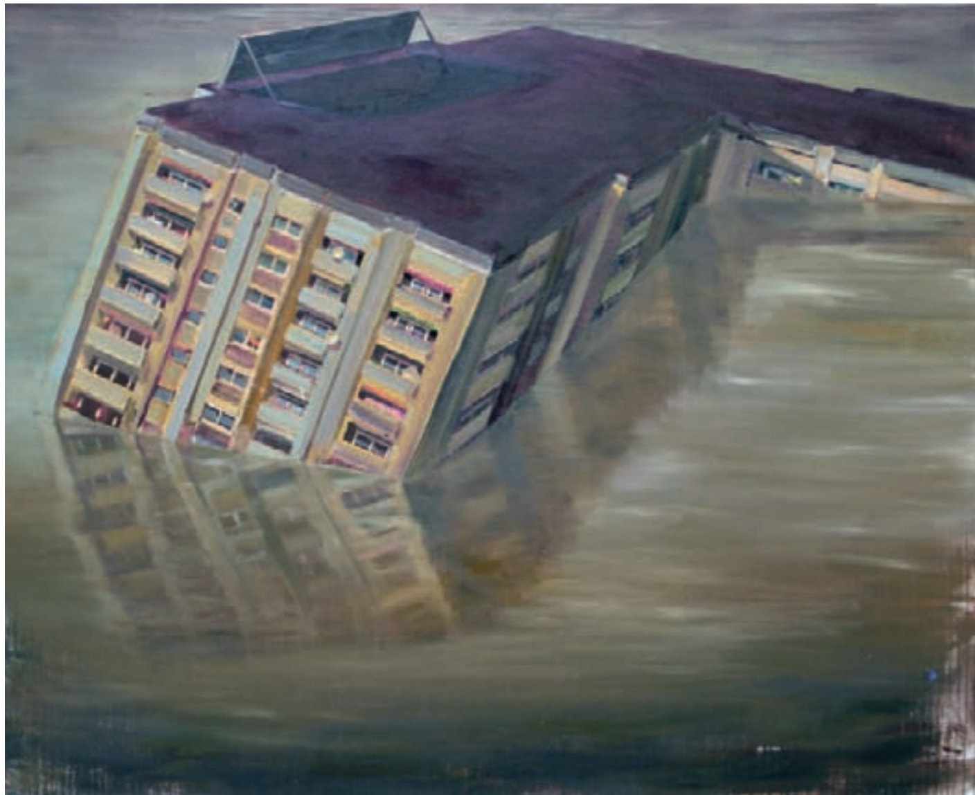
» Redemption (Hochhaus) « Öl auf Leinwand, 170 cm x 210 cm → 2008