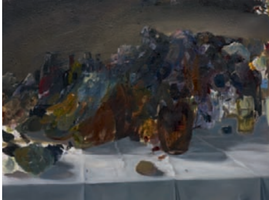
» Nature Morte I « Öl auf Leinwand, 90 cm x 120 cm – 2008