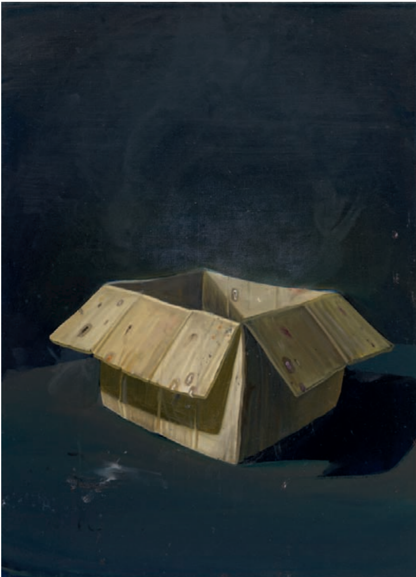
» Ohne Titel (Malerkoffer) « Öl auf Leinwand, 110 cm x 80 cm – 2009