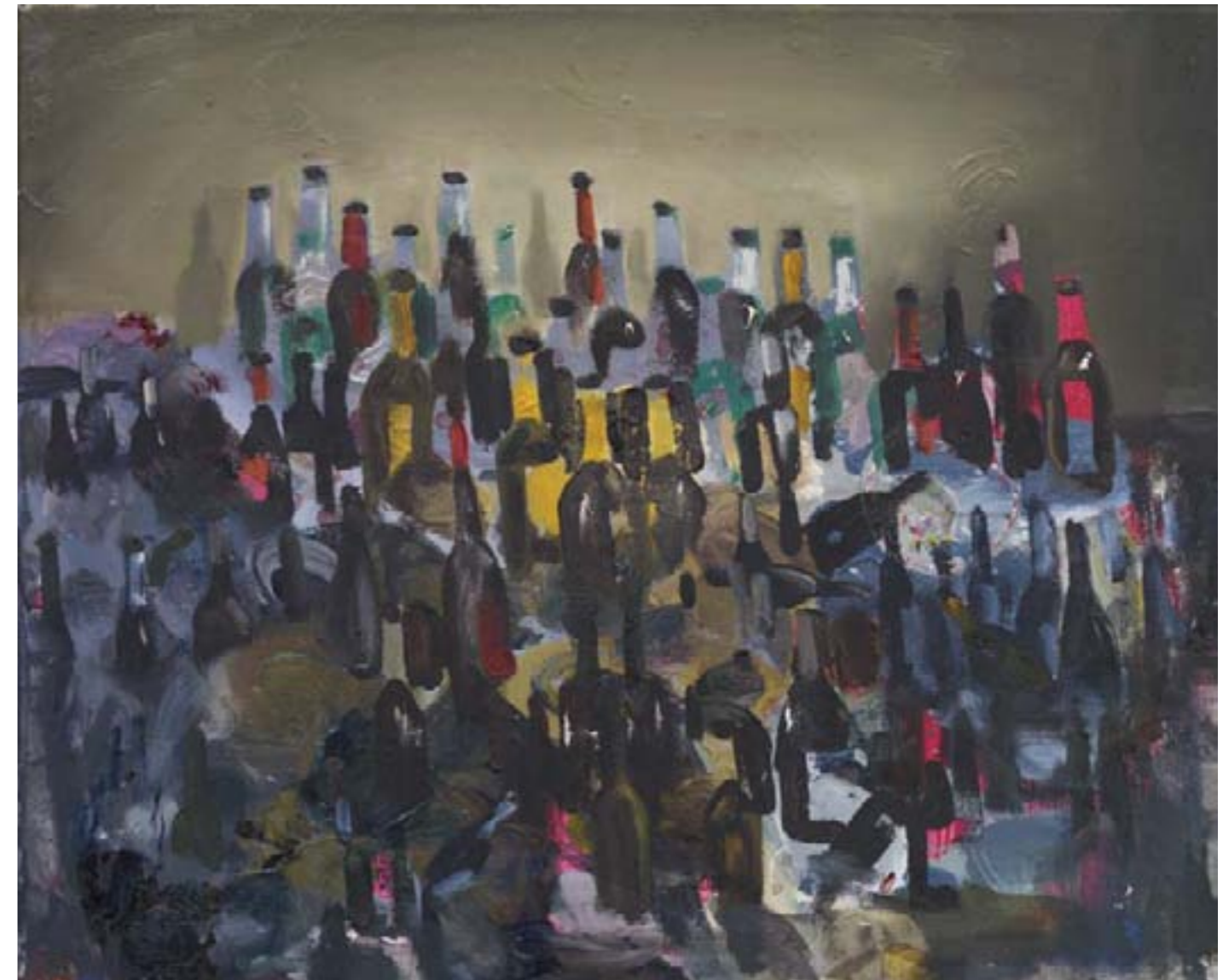
» Arrangement « Öl auf Leinwand, 50 cm x 60 cm – 2008