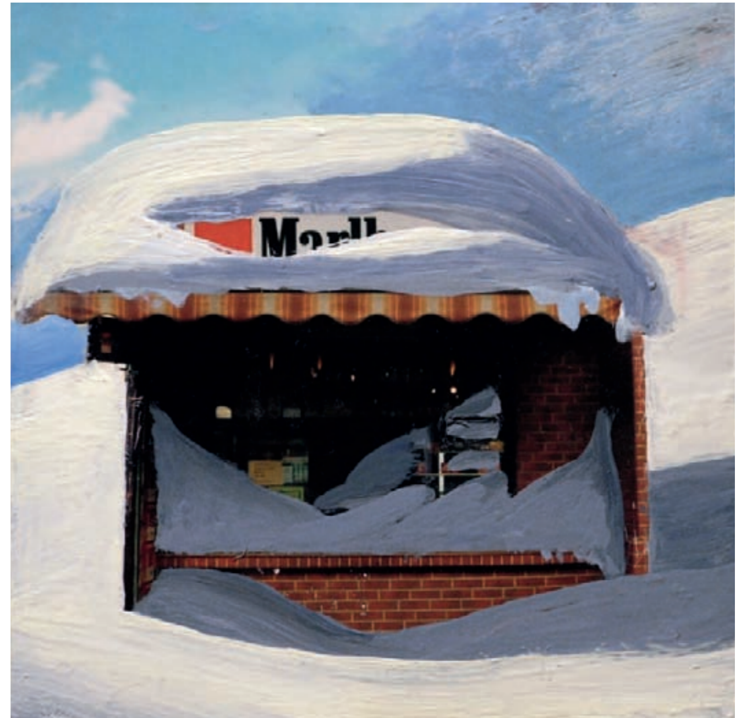
» Marli « Öl auf Fotografie, 9 cm x 9 cm – 2010