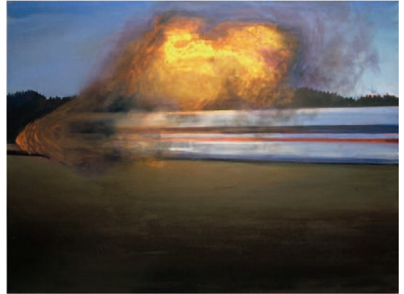
» Burning ICE « Öl auf Leinwand, 180 cm x 240 cm – 2009

Angefangen hat Mühlenbrink 2003 mit An- oder Aufsichten quer im Bild stehender Container, deren groß ins Bild gesetzte Oberflächen von innen oder von außen regelrecht zerfressen aussehen (S. 9). Die unruhigen Flächen, die solche Müllcontainer an der Außenseite schon allein durch ihr Ausgesetztsein bei Wind und Wetter auf der Straße ausbilden, faszinierten ihn, da sie eigenständige Zufallsbilder und reale Oberflächen zugleich sind. Zunächst als Steilvorlage und Experimentierfeld zum Ausprobieren diverser malerischer Oberflächen genutzt, sucht der Künstler daraufhin stehen gelassene Flächen (Kartonagen, Aluminiumteile) und baut sie da und dort in seine Bilder ein (S. 8).