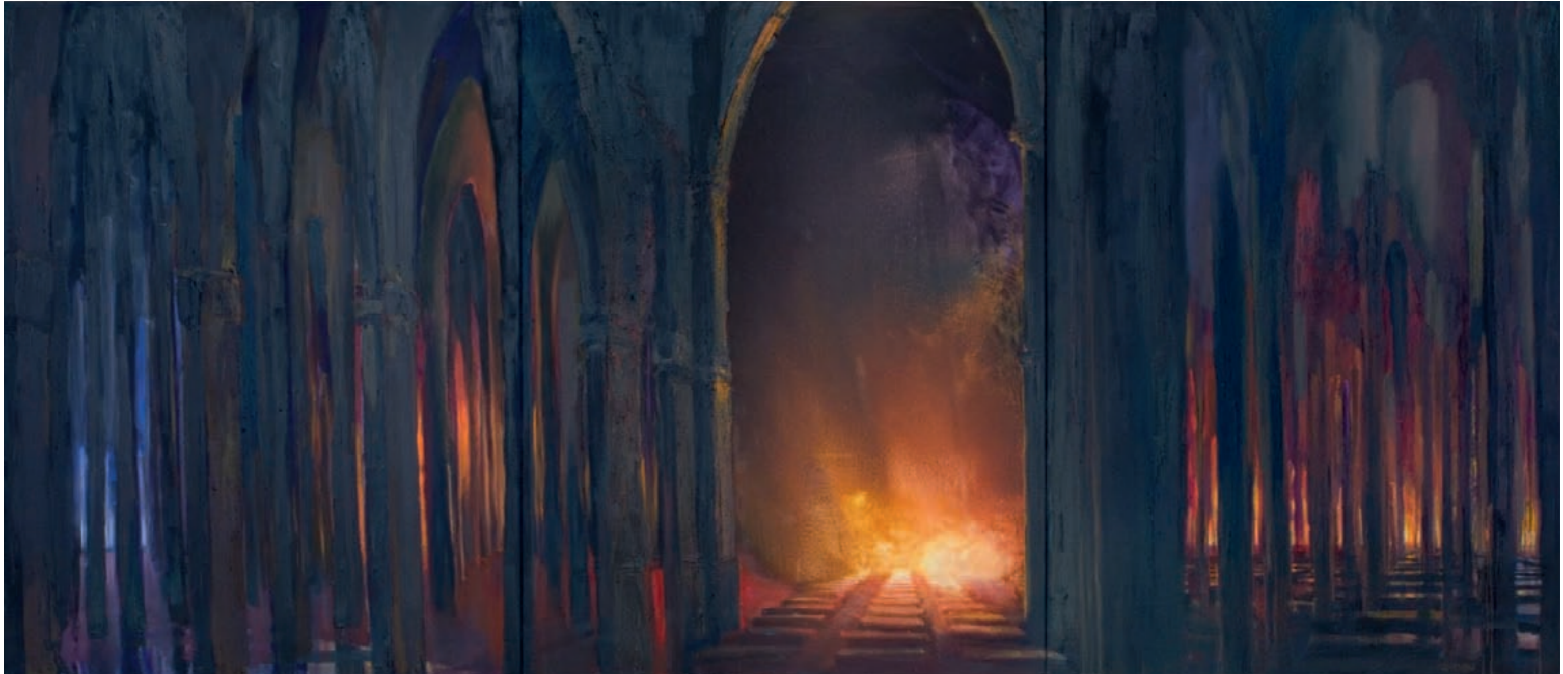
» Notre Dame « Öl auf Leinwand, 210 cm x 510 cm (dreiteilig) ~ 2007