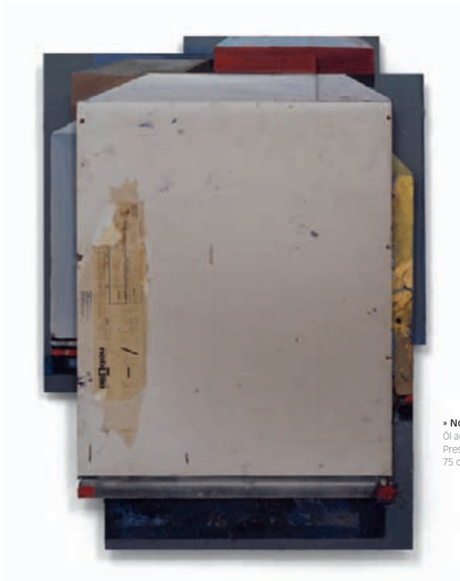
» Nobilia « Öl auf diversen Pressspanplatten, 75 cm x 56 cm – 2009