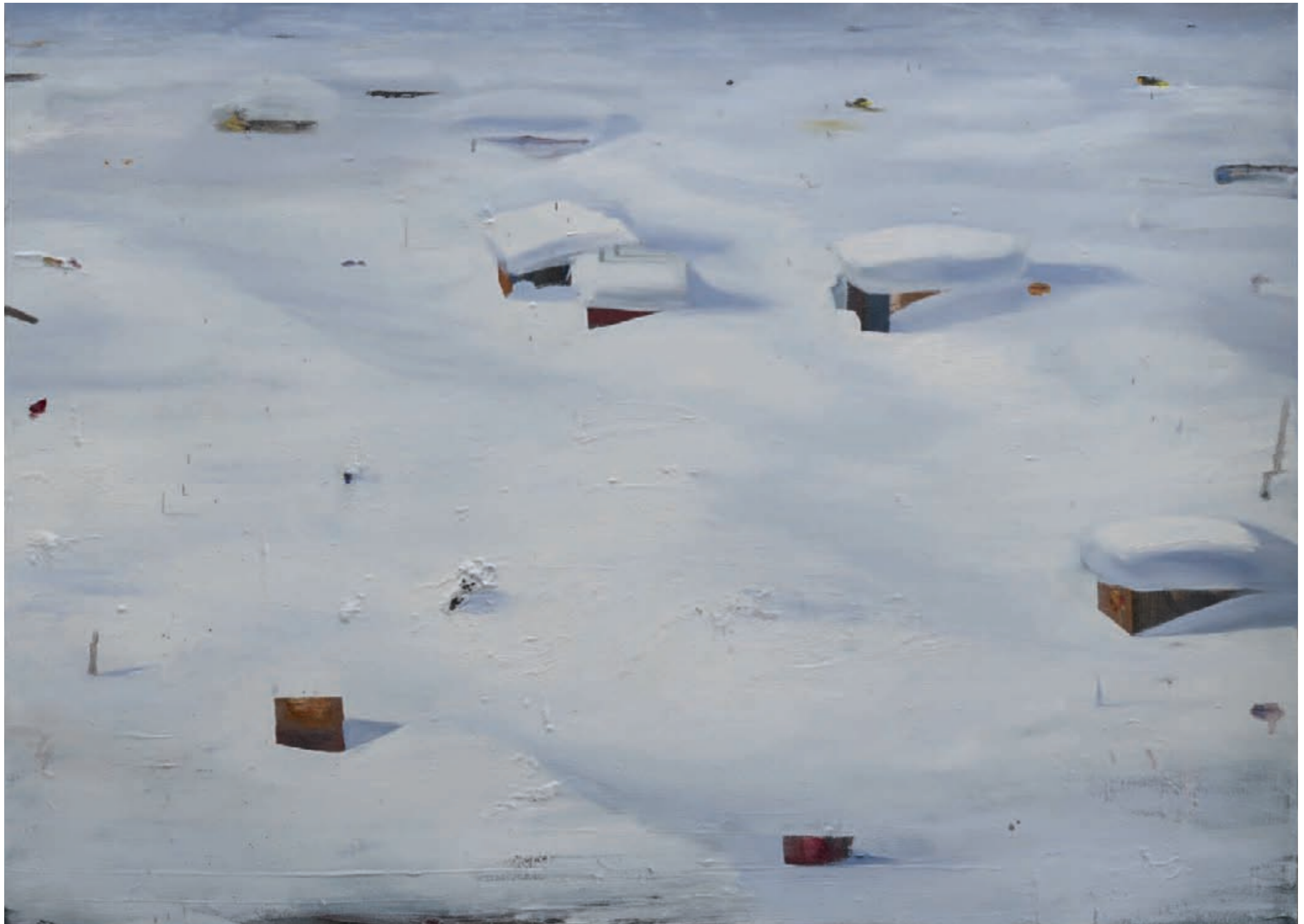
» Land unter « Öl auf Leinwand, 80 cm x 110 cm – 2010