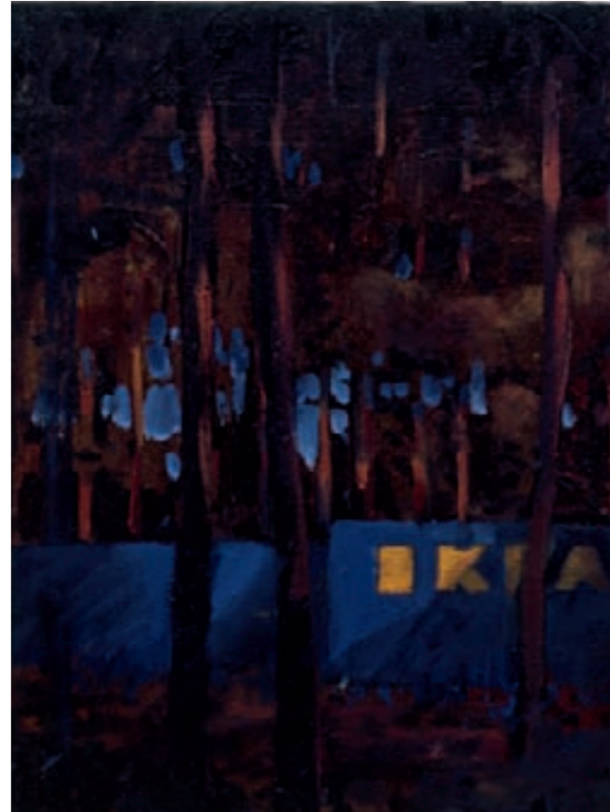
» IKA « Öl auf Leinwand, 40 cm x 30 cm – 2009