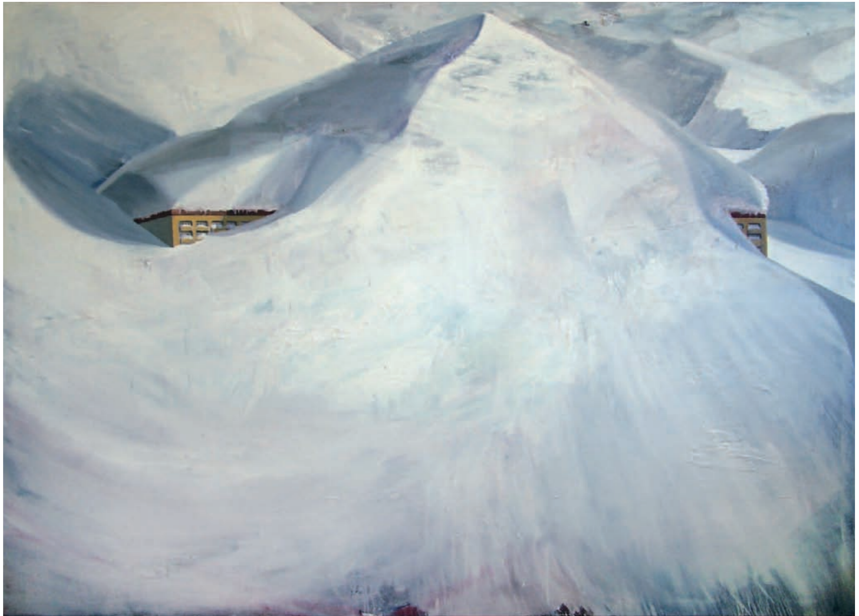
» Schneeanstalt « Öl auf Leinwand, 130 cm x 180 cm – 2007