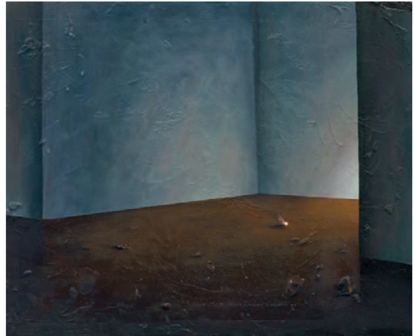
» Ohne Titel « Öl auf Leinwand, 40 cm x 50 cm – 2009