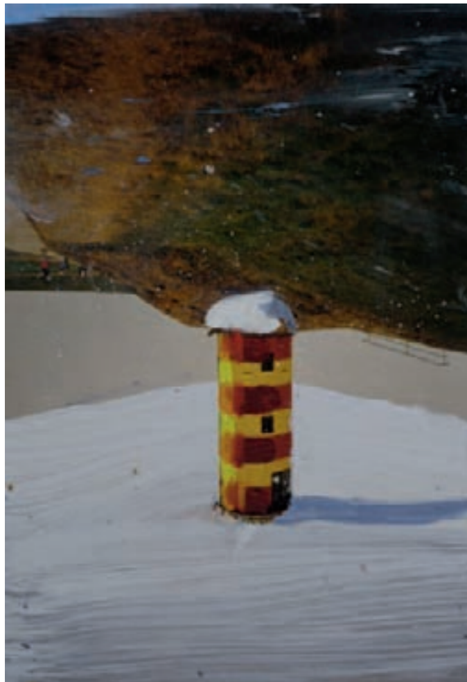
» Leuchtturm « Öl auf Fotografie, 13 cm x 9 cm – 2010