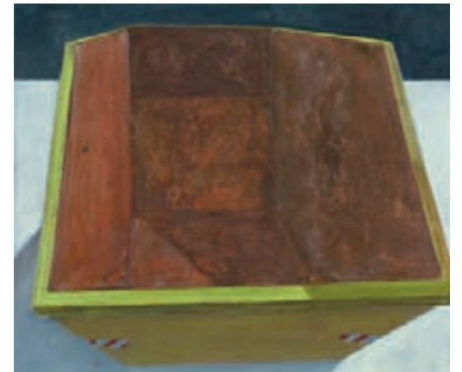
» Container II « Öl auf Leinwand, 90 cm x 105 cm – 2003

Der Triumph des Bildnerischen über dem Erzählerischen bei Mühlenbrink gelingt immer dann, wenn beide Seiten nicht gewinnen, sondern in visueller „Zweifalt“ (Martin Heidegger) nebeneinander bestehen bleiben. Der Zustand zwischen dem „noch nicht“ und „nicht mehr“ seiner Malerei, der sich in den Dialog von autonomer und narrativer Bildsprache einschleicht, soll aber nicht den Wortwitz unterschlagen, den der Künstler unter anderem in seinen Kiosk- oder Lasterbildern zeigt. Der Inflation und unhintergehbaren Dominanz medialer Bilder in unserer Welt begegnet er mit einer Entleerung der Bedeutung des Bildgegenstands zugunsten einer neu definierten Bildlichkeit, sei es im „Bild“ (Kiosk) oder in der Serie der Laster, die vieldeutig das Fahrzeug und die Last, an so vielen Bildern als Künstler heute „zu tragen“, ins Spiel bringt. Dem lustvollen „Hunger nach Bildern“, den Wolfgang Faust noch in der Wilden Malerei der 1980er Jahre ausmachte, weicht hier eher eine bedrängte und manchmal klaustrophische Bildnatur. Mühlenbrinks Werk zeichnet eine erfrischende Diversität malerischer Ansätze und Motive aus, die noch unabhängig nebeneinander bestehen. Wir erwarten deshalb mit Spannung, wie sich das Werk weiterentwickeln wird.