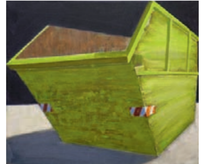
» Container I « Öl auf Leinwand, 90 cm x 105 cm – 2003