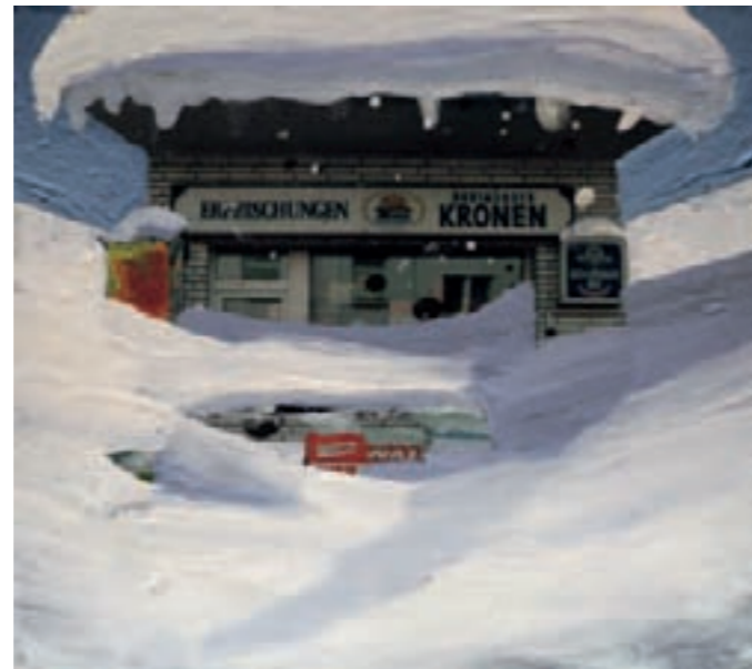
» WAZ « Öl auf Fotografie, 9 cm x 10,5 cm – 2010