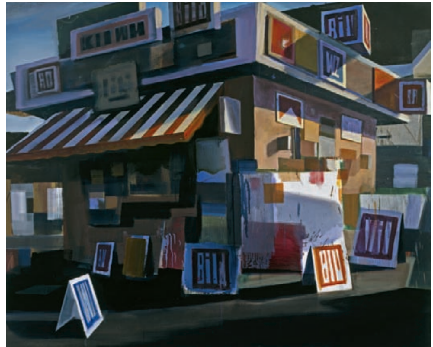
» Bams II « Öl auf Leinwand, 170 cm x 210 cm → 2009