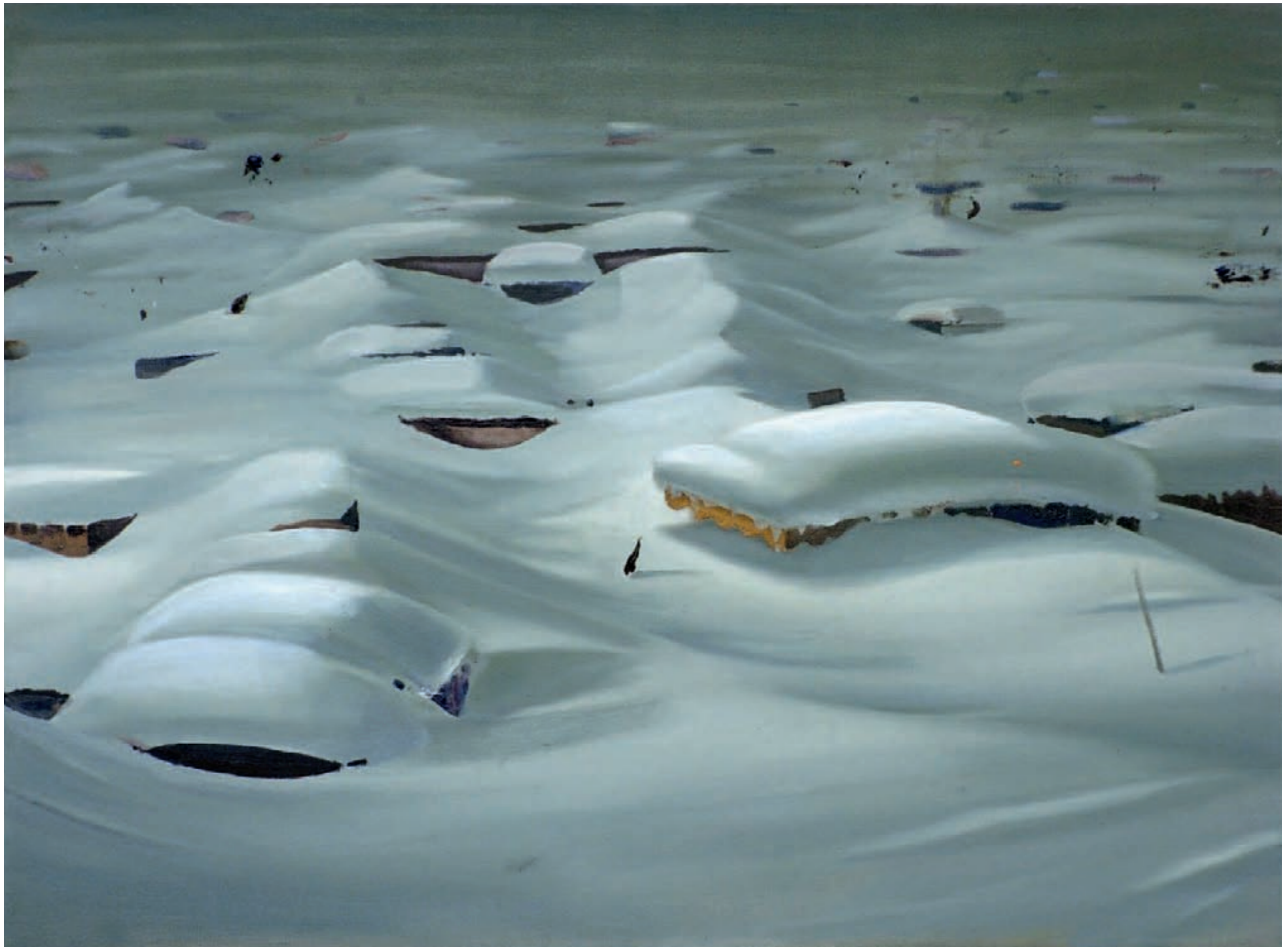
» Schneedecke « Öl auf Leinwand, 70 cm x 100 cm – 2010