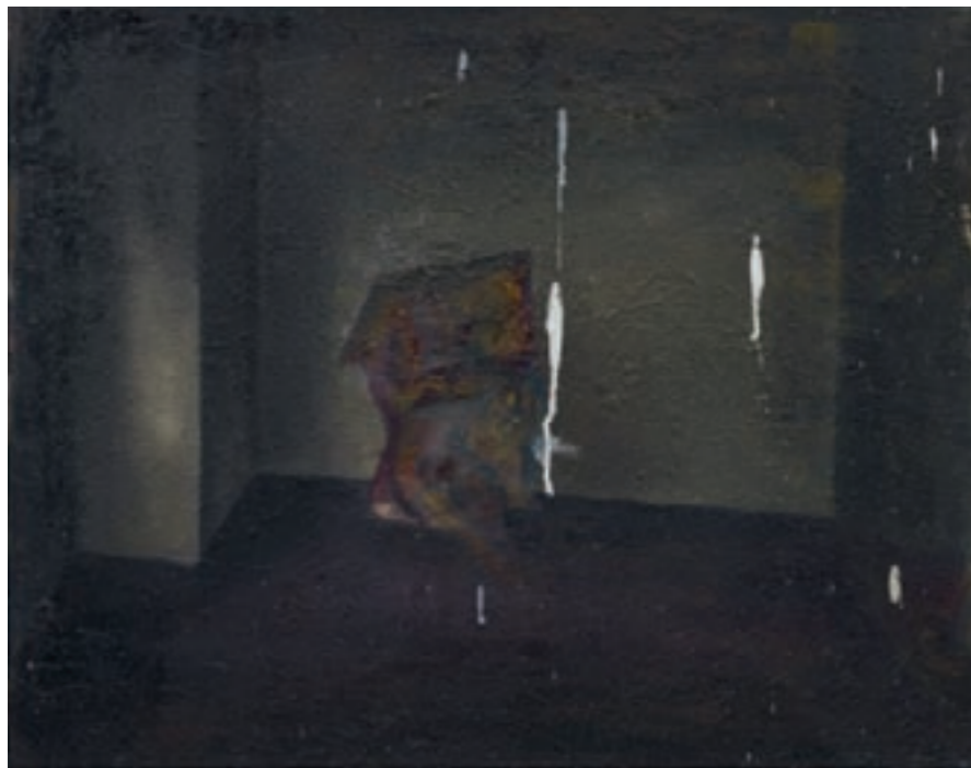
» U.S.O. « Öl auf Leinwand, 40 cm x 50 cm – 2008