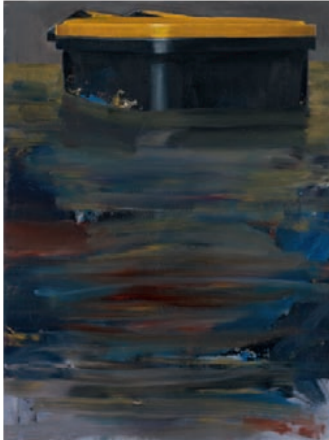
» Gelbe Tonne « Öl auf Leinwand, 80 cm x 60 cm – 2010