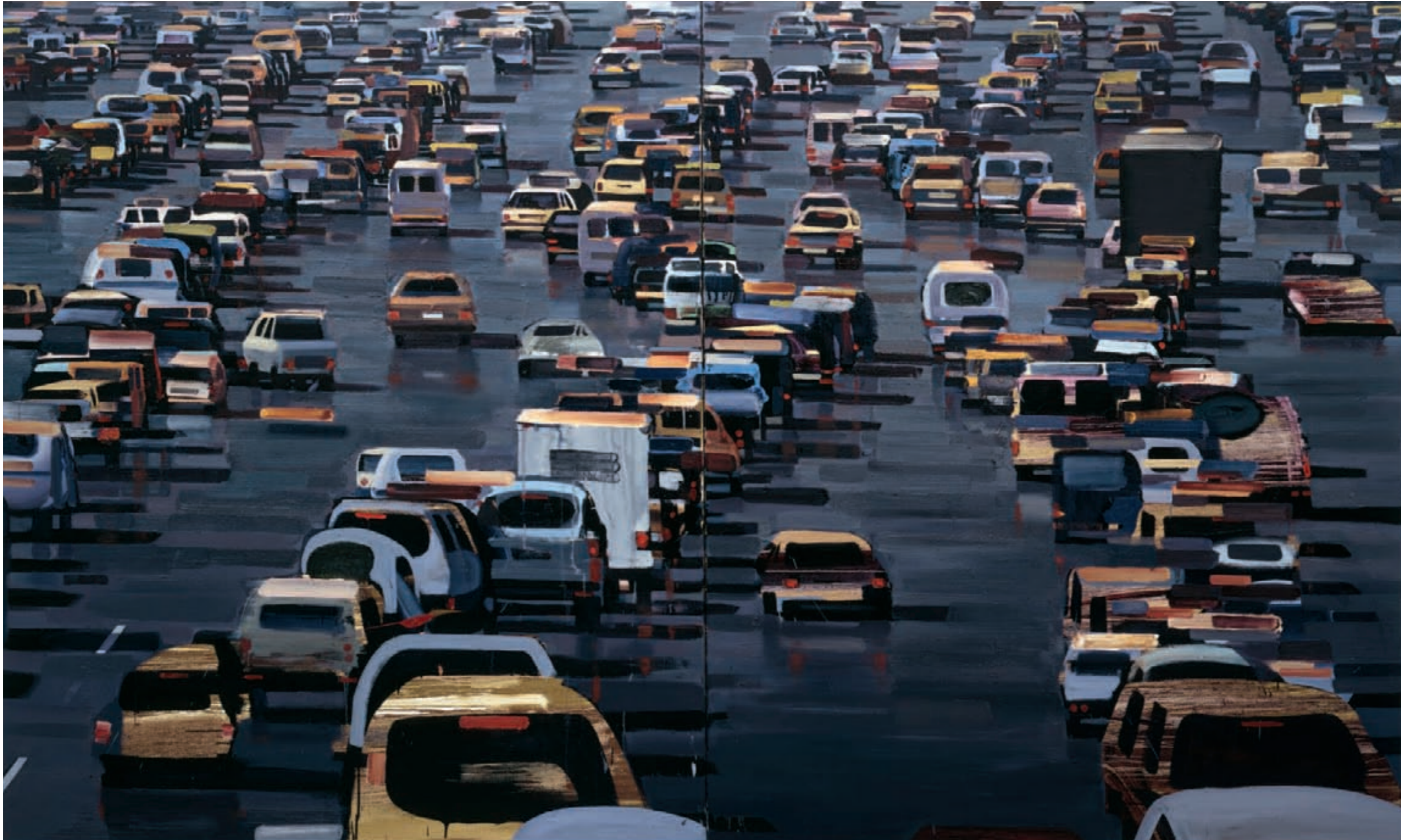
» Stau « Öl auf Leinwand, 180 cm x 300 cm – 2009