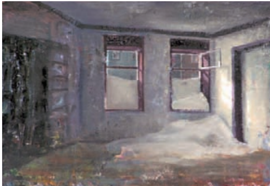
» Home (Bruch) « Öl auf Leinwand, 60 cm x 80 cm – 2007